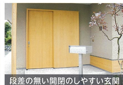
段差の無い開閉のしやすい玄関