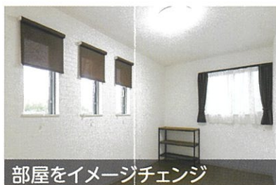
部屋をイメージチェンジ