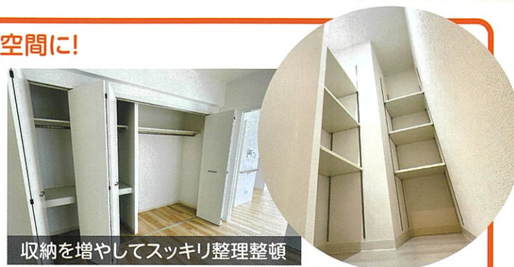
収納を増やしてスッキリ整理整頓