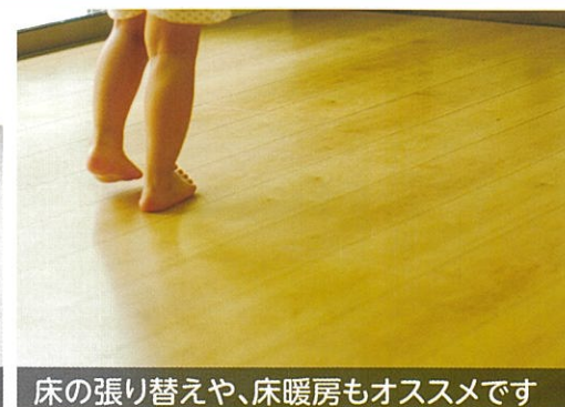
床の張り替えや、床暖房もオススメです