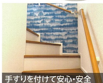
手すりを付けて安心・安全