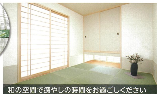
和の空間で癒やしの時間をお過ごしください