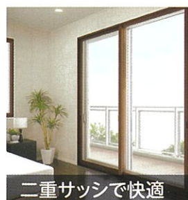
二重サッシで快適